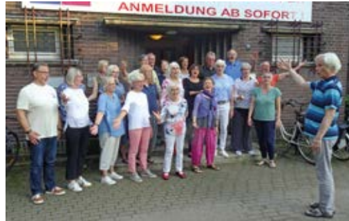
Alegria Cantar 2023